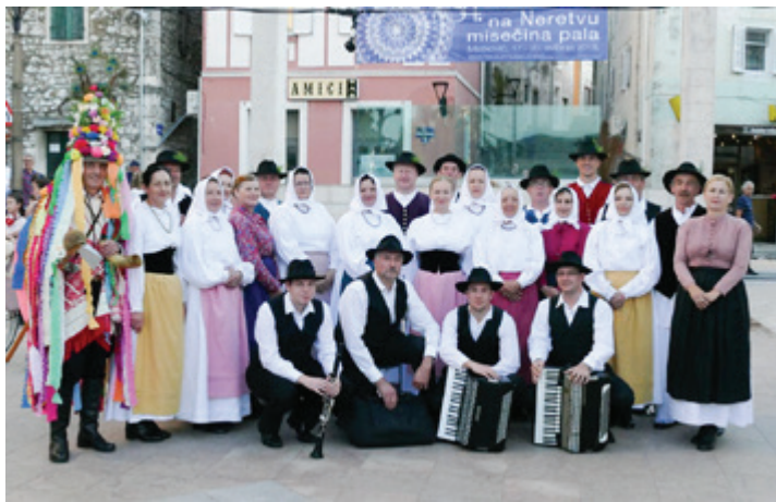
Veteranska FS KUD Beltinci