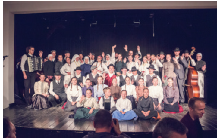
Folklorniki KD Marko