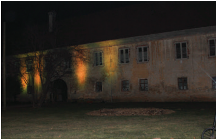
15. februarja smo v podporo otrokom in mladostnikom, ki so zboleli za otroškim rakom osvetlili beltinski grad z rumeno svetlobo