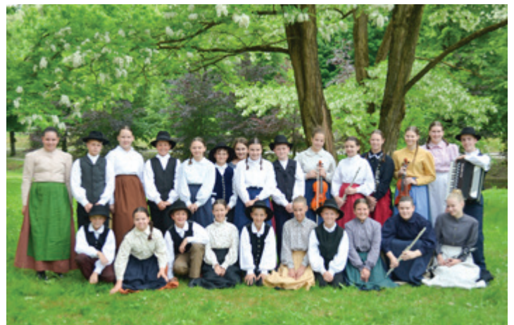
Folklorniki KD Veseli Marki